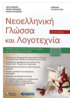
Συγγραφείς: Ζέτα Κακούρη, Πέννη Παρνασσά, Βιολέττα Κοσκινά Σελίδες: 575