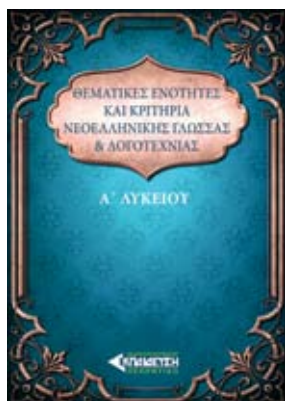
Συγγραφείς: Πέννη Παρνασσά, Βιολέττα Κοσκινά Σελίδες: 151